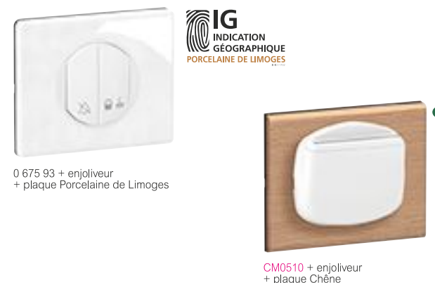
0 675 93 + enjoliveur + plaque Porcelaine de Limoges