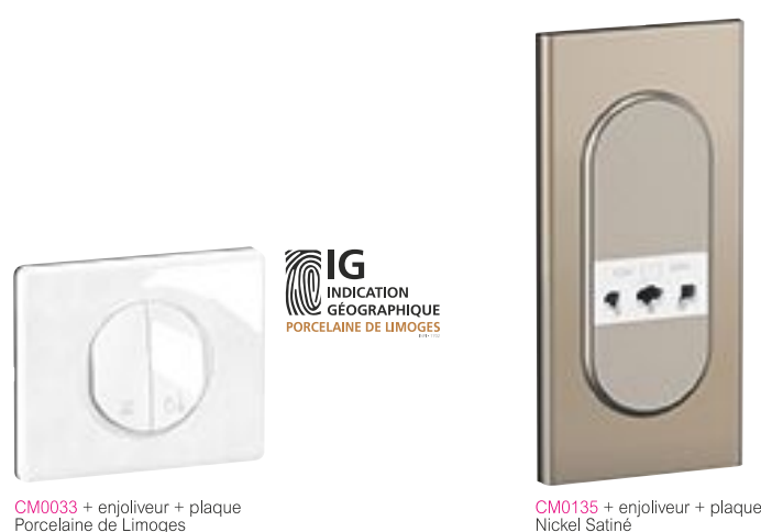
CM0033 + enjoliveur + plaque Porcelaine de Limoges